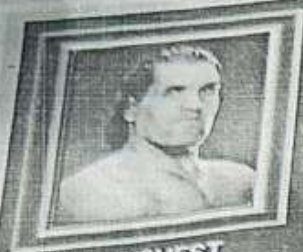
CHIEF GUEST THE GREAT KHALI